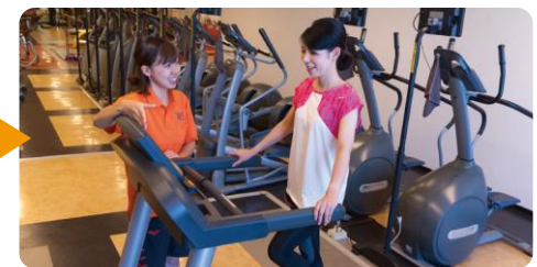
有酸素運動で気持ちいい汗をかきます ウォーキングやジョギングを行います。

▼まずはお電話ください。その際に「お試しフィットネスに申し込みしたいんですが」とお問い合わせください。▼