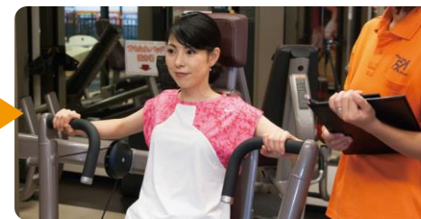
ウェイトトレーニングに挑戦 トレーナーが使い方、姿勢、回数等を丁寧にご案内。